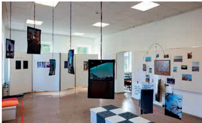
Museum Korneuburg: Ausstellung der Sequenz 2 von „STOPOVER Korneuburg“

Mai 2024 im Stadtmuseum Korneuburg zu sehen. Sonntags von 9–12 Uhr können Interessierte einen Einblick in die Sicht von Jugendlichen zum Thema „Unterwegs“ gewinnen.