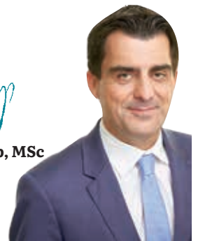
Christian Gepp, MSc Bürgermeister der Stadt Korneuburg