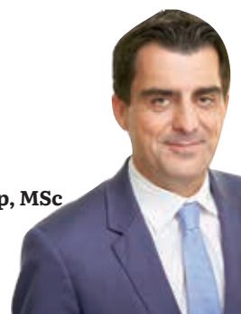
Christian Gepp, MSc Bürgermeister der Stadt Korneuburg