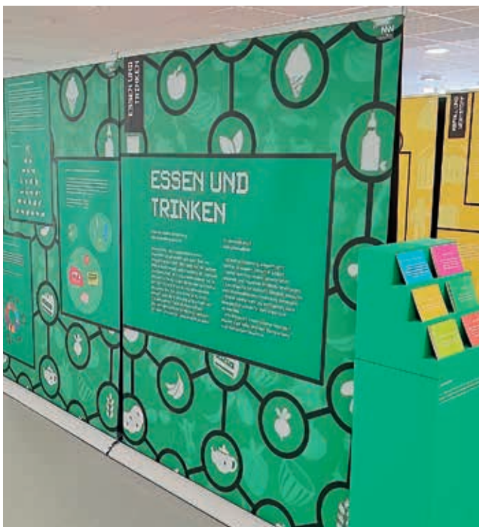
Wanderausstellung: KLAR! 10vorWien brachte die Wanderausstellung „Klima & Ich“ ins Korneuburger Rathaus.