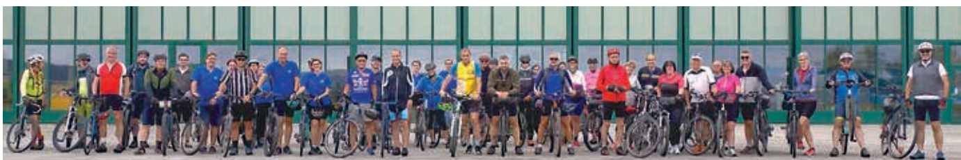
Gruppenerfolg: Zahlreiche Teilnehmerinnen und Teilnehmer folgten der Einladung des ABC-Abwehrzentrums und radelten gemeinsam für den guten Zweck entlang der Donau.

Ein herzlicher Dank gilt auch den Sponsoren wie Sparkasse Korneuburg, Steuerberatungskanzlei Seifert, Transgourmet und dem Forum ABC-Abwehr für die Teilnahme am Charity-Biking.