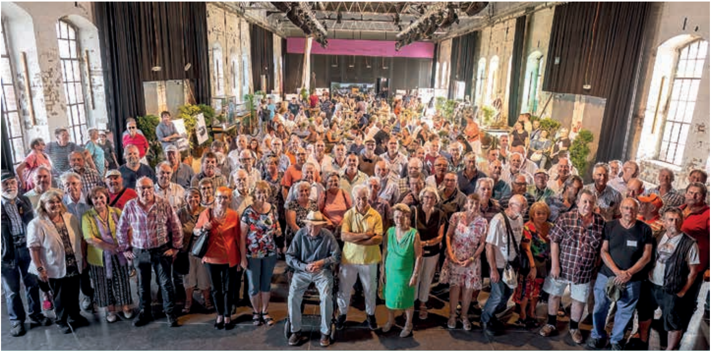
Treffen der Werftler:innen: 60 ehemalige Mitarbeiter:innen der Werft trafen sich am Hafenfest und schwelgten gemeinsam in Erinnerungen.