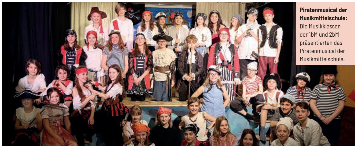
Piratenmusical der Musikmittelschule: Die Musikklassen der 1bM und 2bM präsentierten das Piratenmusical der Musikmittelschule.