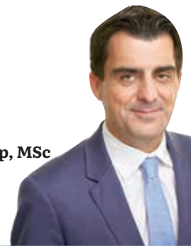
Christian Gepp, MSc Bürgermeister der Stadt Korneuburg