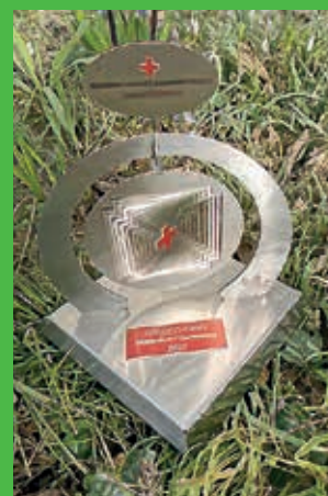
Preisverleihung: Henry Award für die Musik-Kreativ-Mittelschule Korneuburg.

ten) und einem Lehrausgang zur „Shades Tour“ in Wien. Dabei entstand für die Kinder ein Einblick in das Leben obdachloser Menschen. Diese Touren an unterschiedliche Plätze der Stadt – von der Bäckerstraße bis zum Stadtpark – werden von Menschen, die selbst von Obdachlosigkeit betroffen waren, geführt und sind von Erzählungen über das einsame Leben auf der Straße abseits der Familie und über die Drogenszene begleitet.