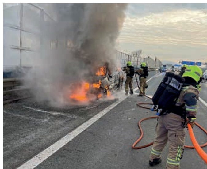
Brandereinsatz: Löscharbeiten eines Fahrzeugbrandes auf der A22 im Dezember 2022.