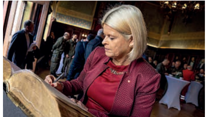
Eintragung ins goldene Buch der Stadt: Bundesministerin Tanner bei der Eintragung ins goldene Buch der Stadtgemeinde Korneuburg.

des Einsatzes konnten neun Personen gerettet und 52 Verletzte medizinisch versorgt werden. Im betroffenen Gebiet in der Türkei sowie im benachbarten Syrien wurden in Summe über 50.000 Tote gezählt.