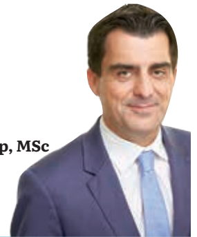
Christian Gepp, MSc Bürgermeister der Stadt Korneuburg