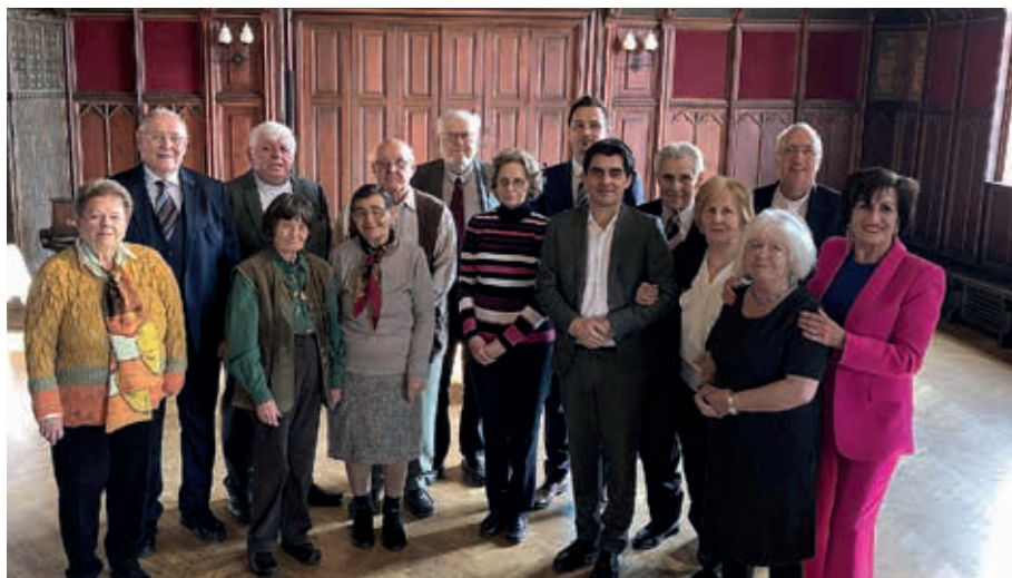
Feier im Rathaus: Gruppenfoto der Jubilar:innen mit Vertreter:innen der Stadtgemeinde.