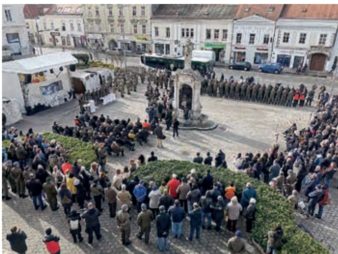
Bundesheer-Festakt am Korneuburger Hauptplatz: Zahlreiche Besucher:innen waren beim Festakt am 20.2.2023 vor Ort dabei.