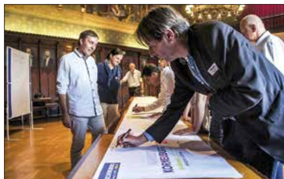
Die TeilnehmerInnen des ersten Workshops sammeln zu unterschiedlichen Schwerpunkten Ideen für Korneuburg.

Weitere Informationen zum Stadtmarkenprozess gibt es auf www.marke-korneuburg.at .