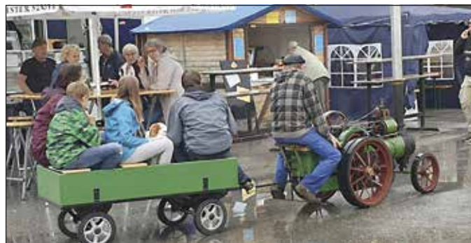
Auch vom Regen ließen sich die Fans alter Fahrzeuge nicht abhalten, ihre Runden im außergewöhnlichen Gespann zu drehen.

Grabanlagen - Fundamente Renovierungen - Inschriften