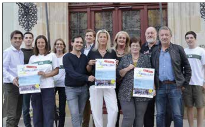
Der Sportausschuss der Stadtgemeinde und der Ruderverein Alemannia freuen sich schon auf den neuen Laufevent.

Melden Sie sich schnell unter www.donaulauf.at an und sichern Sie sich Ihr regionales und nachhaltiges Startersackerl.