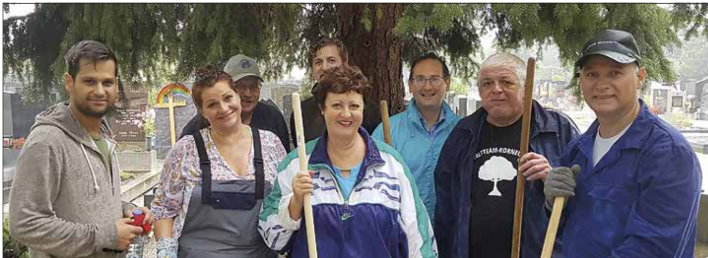
Dank des Umweltteams und der Freiwilligen, die mithalfen, wurden die Wege des Friedhofs vom Unkraut befreit.

Durchnässt, aber mit einem breiten Lächeln auf den Lippen, so waren unser Umweltteam und die weiteren Freiwilligen bei der Friedhofsreinigung in Aktion. Ob gebückt mit der Hand oder mit passenden Harken sagten sie dem Unkraut entlang der Wege den Kampf an. Da Korneuburg vorbildliche Arbeit im Umweltschutz leis-