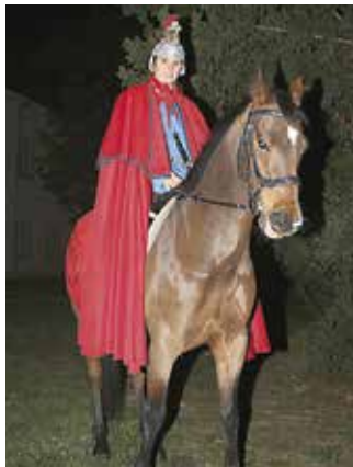
Hoch zu Ross führt der „heilige Martin“ den jährlichen Umzug vom Kirchenplatz zum Rathaus an.

Die Jungschar stellt wieder die Legende des beliebten Heiligen als Theaterstück nach. Gemeinsam mit dem berittenen Martin ziehen die Kinder vom Kirchenplatz zum Rathaus, wo gemeinsam gefeiert wird.