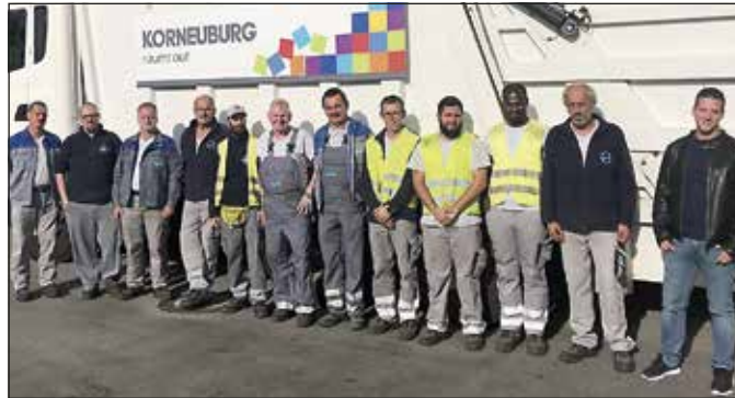
Das Team der Abteilung Abfallwirtschaft ist ständig unterwegs, um Korneuburg sauber zu halten.

Ein weiterer, wenn auch weniger prominenter Teil