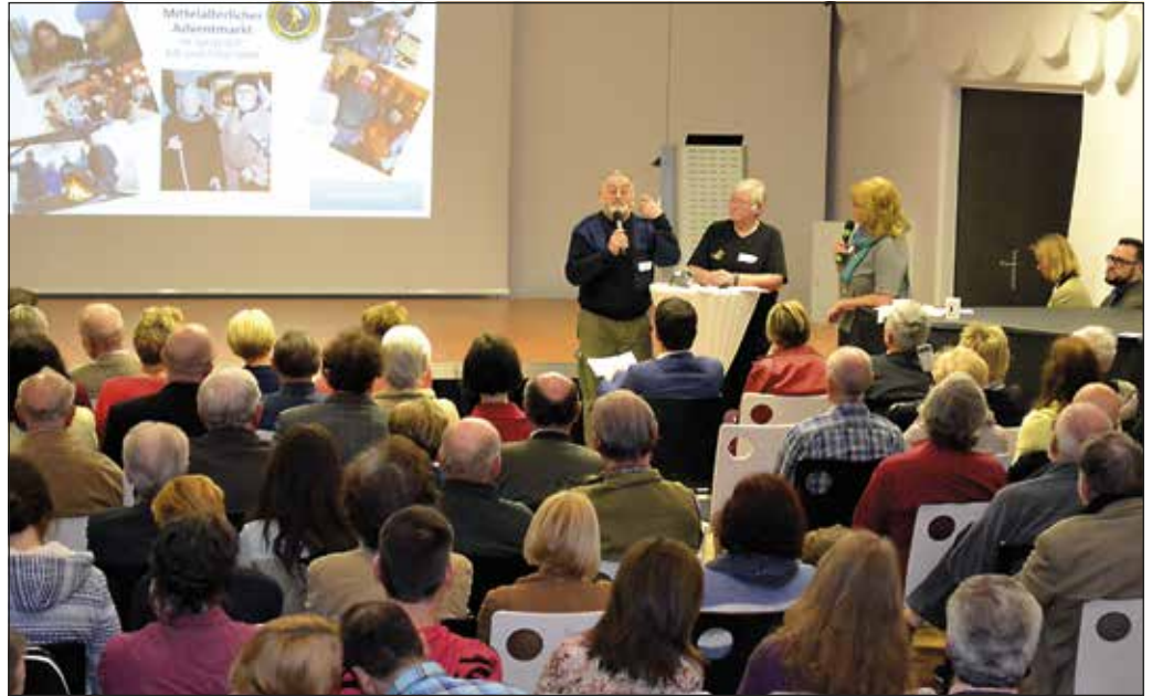
Zahlreiche BürgerInnen informierten sich über die laufenden Projekte beim vergangenen Zukunftsforum in unserer Stadt.

Um zu zeigen, was sich in den Lebensbereichen getan hat und was für die nächsten Monate und Jahre geplant ist, lädt die Stadtgemeinde Korneuburg am Donnerstag, den 7. November um 19 Uhr zum Zukunftsforum in den Stadtsaal ein.