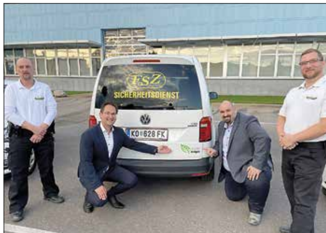
Der FSZ ist in Korneuburg für die Sicherheit unterwegs. Seit 2019 sogar komplett CO 2 -neutral, mit Erdgas und Elektrizität statt Benzin.

Dank der Initiative „Gemeinsam sicher“ arbeiten die Stadtgemeinde, der Sicherheitsdienst FSZ und die Polizei eng zusammen, um Korneuburg noch sicherer zu machen. Dass diese Initiative bereits Früchte trägt, merkt man daran, dass der FSZ von Jänner bis August nur achtmal die Polizei hinzuziehen musste.