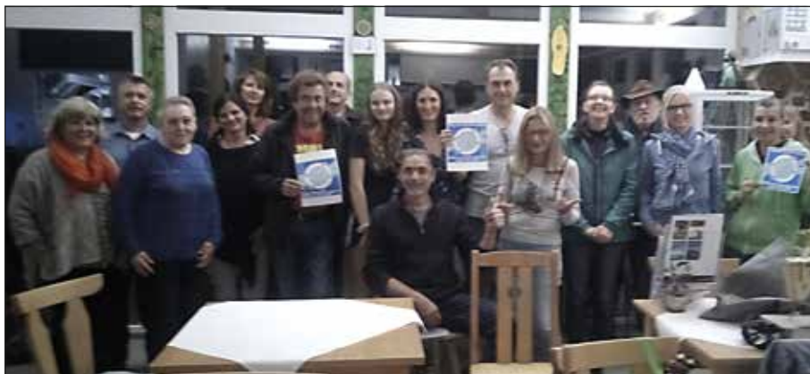
Das Reparaturcafé bringt viele Menschen zusammen, die lieber basteln und reparieren als neu zu kaufen.

Beim zweiten Treffen zum Reparaturcafé haben sich wieder zahlreiche „Helden am Werkzeugkasten“ eingefunden und waren sich einig: Wir wollen tun statt reden!