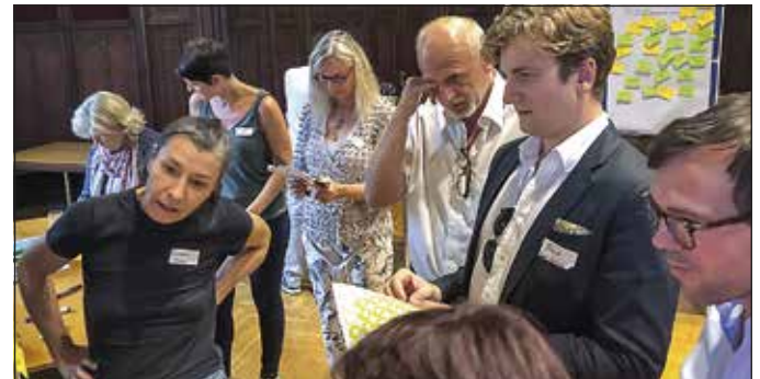
Auch beim Markenprozess ist die BürgerInnenbeteiligung aktiv involviert.

Beim Zukunftsforum werden auch die ersten TrägerInnen der Auszeichnung „Korneuburger Herz“ vorgestellt.