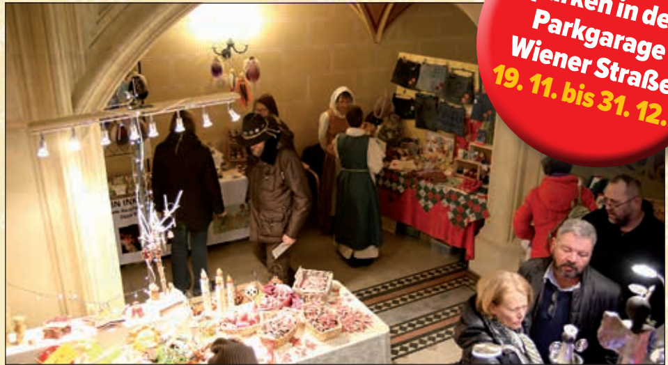
Beim Mittelalterlichen Adventmarkt dürfen sich die BesucherInnen auch heuer auf einen gelungenen Mix aus traditionellem Handwerk und modernem Design freuen.

Im Vorjahr hielten viele es noch für einen Scherz, aber der Mittelalterliche Adventmarkt übernimmt heuer tatsächlich das Büro des Bürgermeisters und verwandelt es in ein „Schmuckkasterl“. Was das bedeutet, finden Sie heraus, wenn Sie von Freitag, den 14. bis Sonntag, den 16. Dezember ins Korneuburger Rathaus kommen.