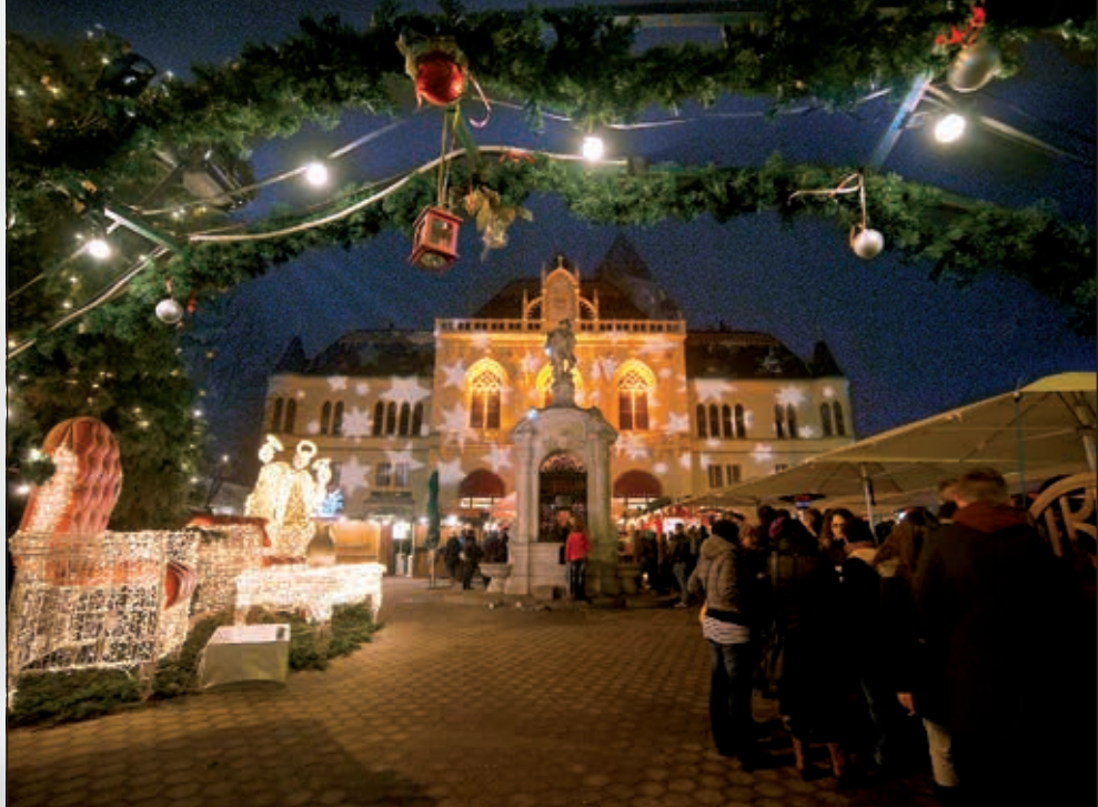
Besinnlich und familienfreundlich, traditionell und trotzdem abwechslungsreich wird „Korneuburg im Advent“.

So ein tolles Kinderprogramm wie 2018 gab es noch nie am Korneuburger Adventmarkt: Sie erwarten der Kinderzug, ein nostalgisches Karussell und an zwei Tagen pro Woche sogar eine Streichelzone des Kleintiervereins und Ponyreiten. Süße Düfte liegen in der Luft, wenn die Kinder in der Bäckerei Geier Kekse backen. Am