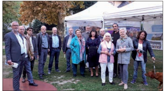
Durch die spannenden Gespräche mit den BürgerInnen erfuhren die VertreterInnen der Stadtregierung und der Verwaltung von einigen Gelegenheiten, wie man Korneuburg noch verschönern könnte.

platzproblemen und verbogenen Straßenschildern bis hin zum Wunsch nach mehr Fußballtoren. Auch das Informationsangebot wurde gern angenommen – von der Bürgerbeteiligung bis hin zum Korneuburger Wasser erregten die unterschiedlichsten Themen das Interesse der BürgerInnen. Neben der Diskussion und Information wurde auch über konkrete Anliegen gesprochen, die ehestmöglich von den MitarbeiterInnen der Stadtgemeinde erledigt werden.