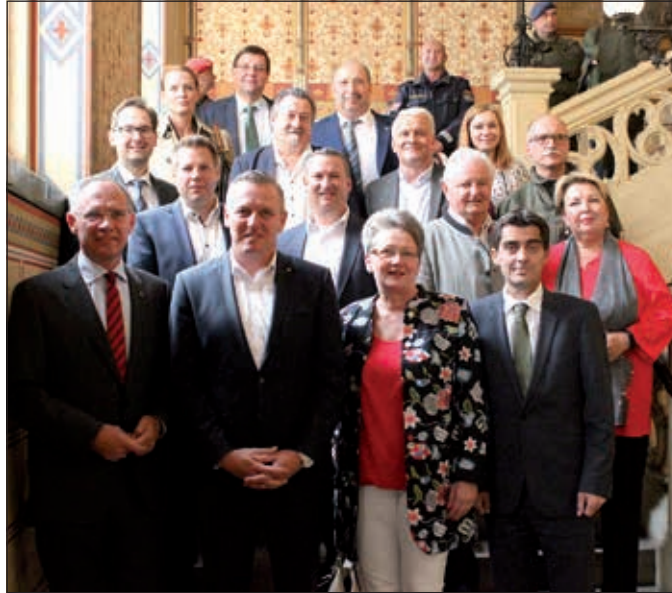
Zur Übergabe der MAMMUT-Dekontaminationsfahrzeuge durch Bundesminister Mario Kunasek kamen wichtige VertreterInnen von Politik, Bundesheer und Blaublichtorganisationen.

Mit dem Sicherheitstag zeigten die Organisationen, wie gut sie zusammenarbeiten – und das nicht nur bei Feiern, sondern auch im Notfall. Ein beruhigendes Gefühl.