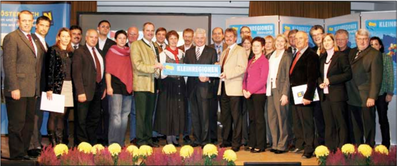
180 AkteurlInnen fanden sich in Hagenbrunn ein, um über Prioritäten in der Kleinregion zu beraten.