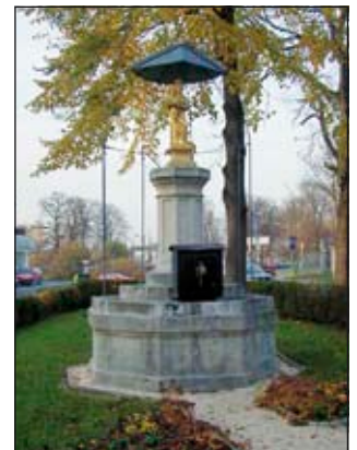
Die restaurierte Mariensäule.

Die Figur der Maria wurde 1848 aus Mariazeller Guss hergestellt und war ursprünglich vor dem sog. Schiffstor, dem ehemaligen mittelalterlichen Stadttor in der Donaustraße, aufgestellt. 1908 wurde das Denkmal an die heutige Stelle versetzt.