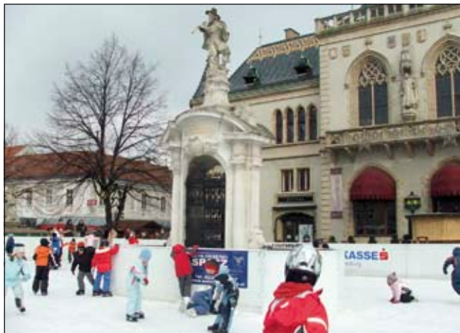
470 Quadratmeter groß ist die Eisfläche vor dem Korneuburger Rathaus – von der Jugend wird sie gern genutzt.

Für alle jene, die bis in die späten Abendstunden bleiben wollen, steht der Eislaufplatz an jedem Freitag und auch zu Silvester bis 22 Uhr offen.