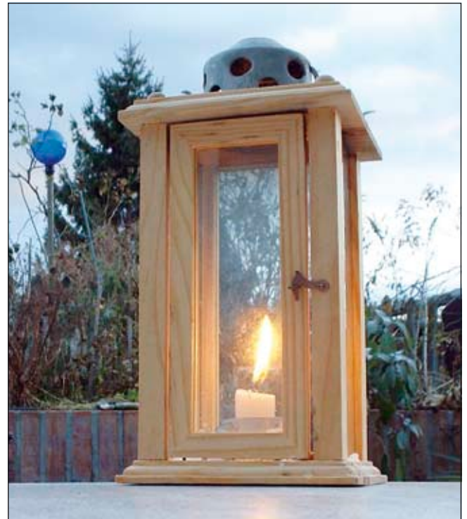
Am Hl. Abend bringt eine Kutsche das Licht von Bethlehem auf den Hauptplatz.

Im Fundbüro hat sich im Laufe der Zeit eine große Anzahl von Rädern und Schlüsseln angesammelt. Sollten Sie irgendwas verloren haben, könnte es im Fundamt liegen. Schauen Sie vorbei.