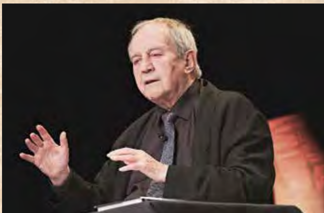
Otto Schenk ist nach wie vor ein großer Künstler, der das Publikum in seinen Bann zieht.