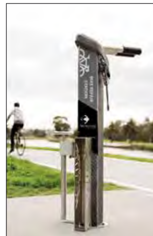
So sieht die multifunktionale Radstation aus.

Die Station wird in Kooperation zwischen Stadtgemeinde Korneuburg, der Energie- und Umweltagentur NÖ und RADLAND im Bereich der Bike-and-ride-Anlage (neben der Firma Felber) errichtet.