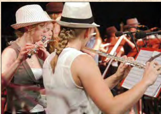
Die jungen MusikerInnen begeisterten das Publikum mit ihrem Können.

Wir freuen uns auf die Werftbühne 2018 und sind schon neugierig auf das kommende Jahr.