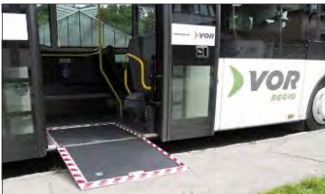
Alle Busse sind künftig barrierefrei.

Gilt für Mo.-Fr., wenn Schultag – an Wochenenden und in den Ferien ist der Busverkehr reduziert!