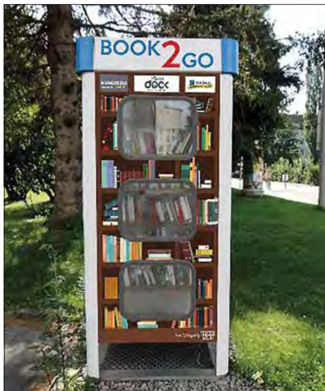
Eine der drei Bücherboxen – für jedermann zugänglich.

Die vielen an der Umsetzung Beteiligten wünschen allen KorneuburgerInnen viel Spaß beim Lesen!