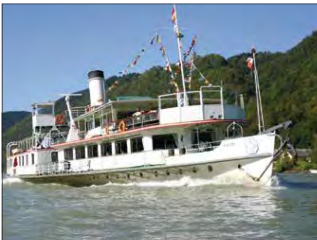
Rundfahrten mit dem Schaufelraddampfer Schönbrunn sind im September in Korneuburg möglich.

Buchungen bitte unter https://www.oegeg.at/termine/termine-schiffahrt . Rückfragen bitte unter 0 699/15 77 09 20 an Frau Gehart vom Stadtentwicklungsfonds.