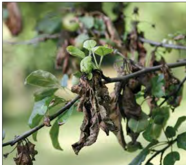
Apfelbaum, mit Feuerbrand befallen. Bitte unbedingt melden!

Die Bezirkshauptmannschaft Korneuburg informiert: Feuerbrand ist eine hochinfektiöse, schwer zu bekämpfende bakterielle Krankheit und stellt eine ernstzunehmende Gefahr für das Kernobst und für anfällige Ziergehölze (Fam. Rosengewächse) dar. Bedroht sind sowohl der Erwerbsobstbau, der landschaftsprägende Streuobstbau als auch Baumschulen, landwirtschaftliche Betriebe, Hausgärten und öffentliche Grünanlagen.