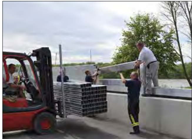
Die Zusammenarbeit zwischen dem Stadtservice und der freiwilligen Feuerwehr funktioniert bestens.

Die Kosten des Hochwasserschutzes beliefen sich auf etwa 11,5 Mio. Euro und werden zu 50 % vom Bund, zu 37,5 % vom Land und zu 12,5 % von der Gemeinde getragen.