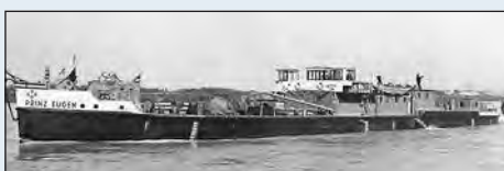
Die „Prinz Eugen“ wurde 1937 in Korneuburg gebaut.

Die Ausstellung zeigt die Entwicklung der Frachtschiffahrt auf der Donau aus Sicht der DDSG vom ersten „Remorkör“ (Schlepper, Zugschiff) auf der Donau, den Schiffen aus der Schiffswerft Kor-