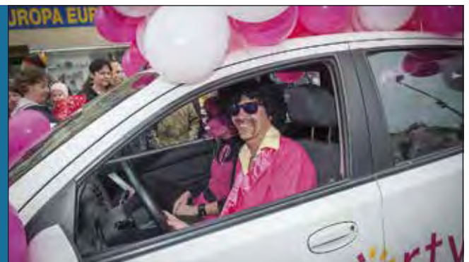
Das Team von Mrs. Sporty hat sich für den kommenden Faschingsumzug schon angemeldet.

Am Faschingdienstag, dem 13. Februar, wird es um 15 Uhr einen Faschingsumzug in Korneuburg geben. Alle TeilnehmerInnen starten in der Laaer Str. Ob als Gruppe, zu Fuß, mit Auto oder Anhänger – ob Verein, Institution, Schule, Unternehmer oder Einzelperson: Jeder kann sehr gerne mitmachen. Anmeldungen bitte unter stadtmarketing@korneuburg.gv.at oder unter 0 22 62/628 99.