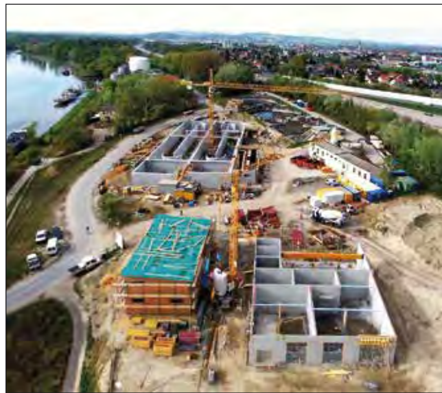
Luftbild der Ausbauarbeiten am Gelände der Kläranlage in Korneuburg.

Höchste Anforderungen werden nun an unser Betriebspersonal gestellt, das den Betrieb der Altanlage trotz der Umbaumaßnahmen sicherstellen muss.