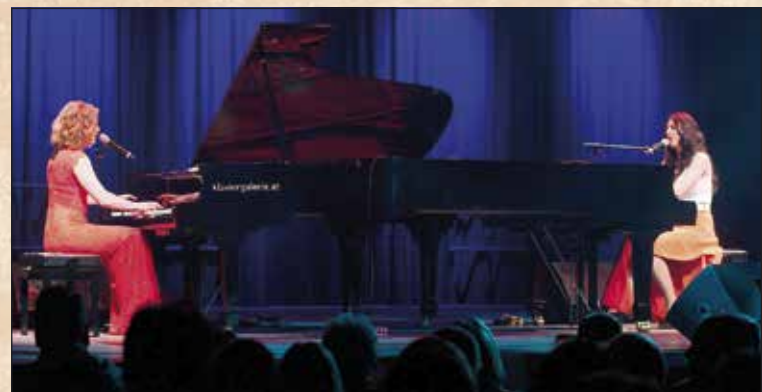
Queenz of Piano unterhielten das Publikum auch mit akrobatischen Einlagen an den Klavieren.

Queenz of Piano begeisterten am zweiten Tag die Besucher der sehr gut gefüllten Halle 55. Die beiden Damen aus Deutschland brachten beste Stimmung mit Klassik und tollen Interpretationen von Coldplay